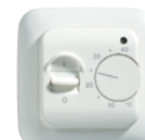
Manuell Termostat MSTAT